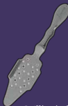
Cuillère à absinthe inox gravée Libertine®