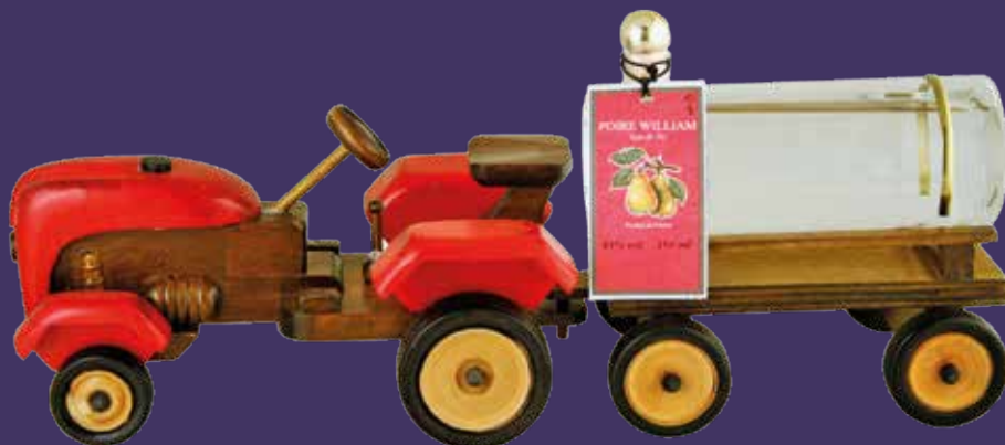
Tracteur avec Eau de Vie de Poire William