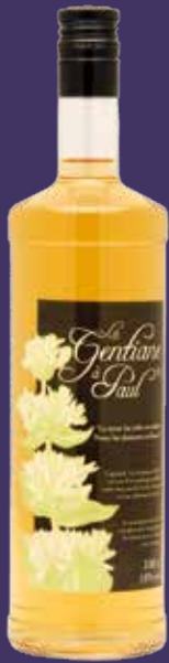
Apéritif à la gentiane