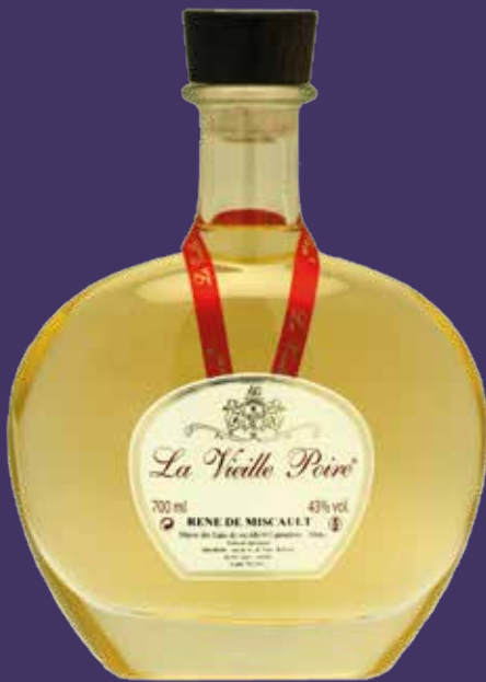
Carafe Hélios 70cl