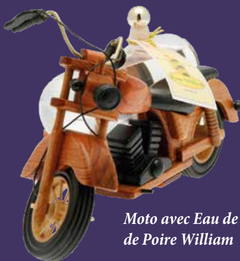
Moto avec Eau de Vie de Poire William