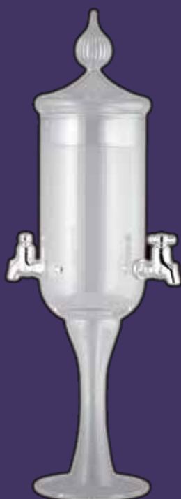
Fontaine 2 robinets