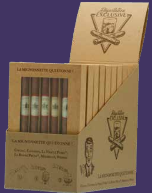
Le coffret de 5 cigares assortis Présentoir de 10 coffrets de 5 cigares

Placez le présentoir sur votre comptoir, près de la caisse... pour un achat Coup de Cœur