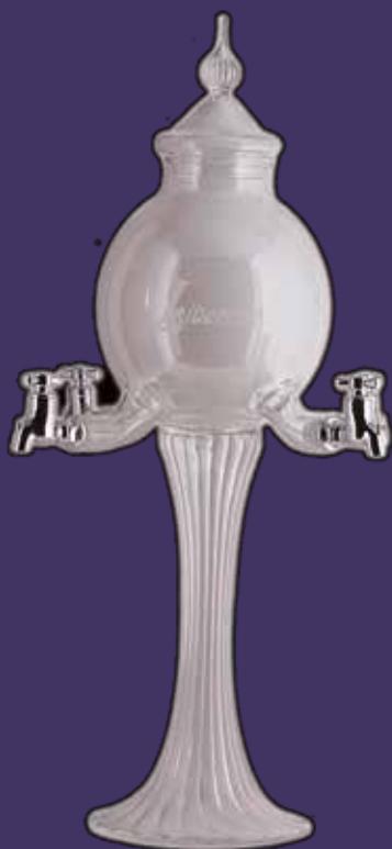
Fontaine Libertine® 4 robinets