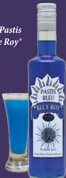
Pastis Blue Roy®

Un pastis au palais typique, anisé avec une note de réglisse, mais qui vous étonnera avec sa belle couleur bleue.