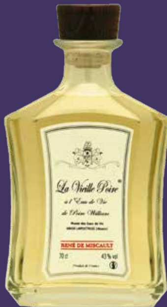
Carafe Athéna 70cl

Ces poires, après fermentation sont distillées en alambic en cuivre.