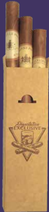
L'étui de 3 cigares 3cl