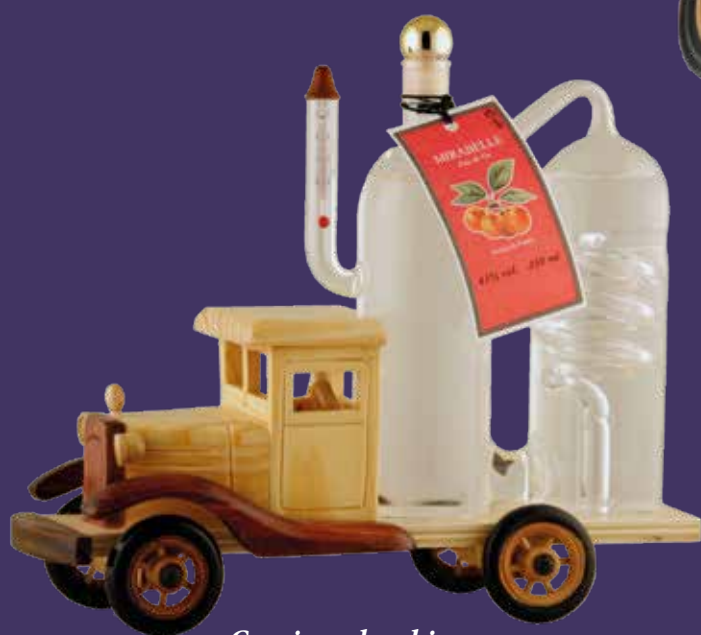
Camion alambic avec eau de vie de Mirabelle