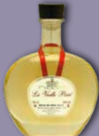
La Vieille Poire®