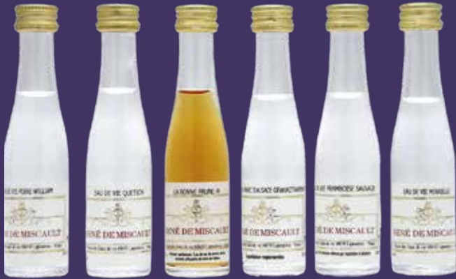
Mignonnettes 3cl à l'unité : eaux de vie, liqueurs, crèmes...